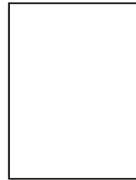
NÁSTENNÝ OZNAČNÍK 330 x 250